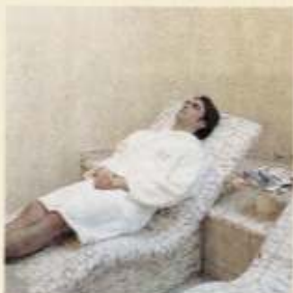
Der Ruheraum bietet dem Gast Entspannung pur.