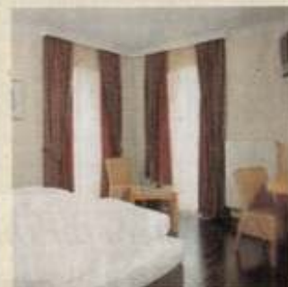
Alle Zimmer strahlen viel Wärme und Behaglichkeit aus.