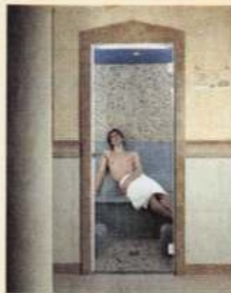
Das Laconium (Dampfsauna) lädt zu gesundem Schwitzen ein.