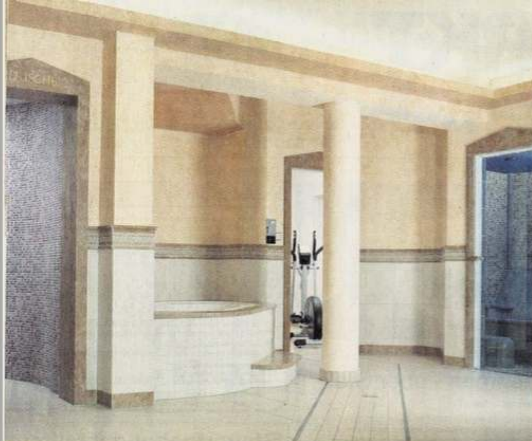
Im Wellnessbereich findet der Hotelgast alles, was sein Wohlbefinden nachhaltig fördert.