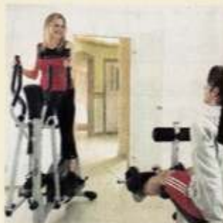
Modernste Kraft- und Cardiogeräte stehen den Gästen im Fitnessraum zur Verfügung.