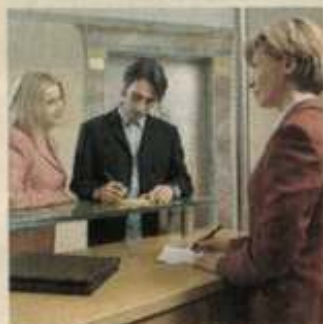
Herzlich Willkommen in unserem 3-Sterne-Hotel.

Der Gasthof Rauch mit Hotel und Restaurant präsentiert sich damals wie heute als gastliches Haus mit aufmerksamen und freundlichem Service. Langjährige und qualifizierte Mitarbeiter sorgen dafür, dass