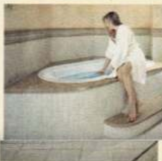
Relaxen im Whirlpool – das ist echter Genuss!