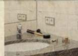
Das elegante Badezimmer bietet ein Höchstmaß an Komfort.

münchen strömte Samstags nach Ettringen zu Rauch. Mancher junge Mann hat hier die Frau für's Leben und manches junge Mädchen ihren späteren Ehemann gefunden". Bis in die 80er Jahre hinein gehörte zum Gasthof Rauch sogar eine Landwirtschaft, die inzwischen aber nicht mehr betrieben wird.